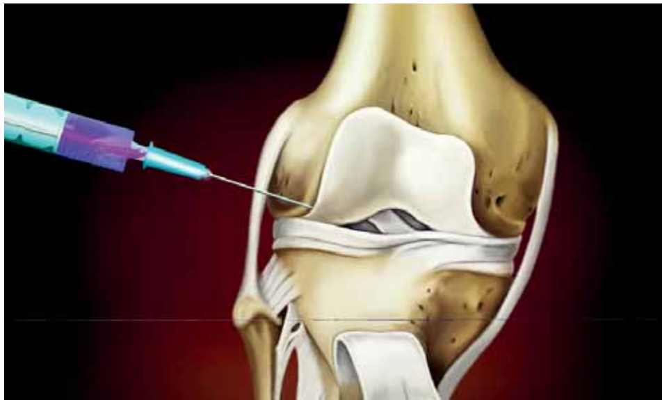
Abb. 2: Intraartikuläre Infiltrationen werden in der Therapie von Arthrosen häufig eingesetzt

Strontiumranelat: Dieser aus der Osteoporosetherapie bekannte Wirkstoff zeigte in einer aktuellen Studie mit 1.371 Patienten eine signifikante, klinische Überlegenheit gegenüber Placebo. Ebenso zeigten sich Hinweise auf chondroprotektive Effekte. Diese Studie alleine reicht allerdings bisher noch nicht aus, um diese Substanz für die Arthrosetherapie freizugeben.